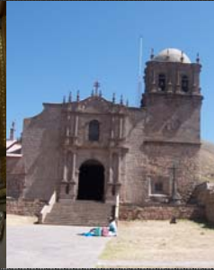
Catedral S. Pedro Mártir