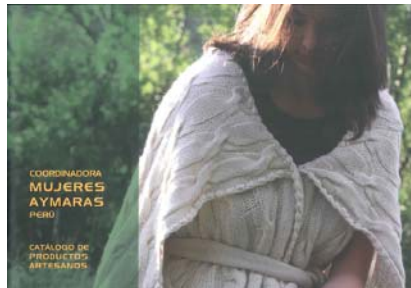
Catálogo colección 2009

La colección 2011 está recién terminada, diseñada en Madrid en los últimos meses del 2010 y elaborada en Juli en el mes de febrero 2011 en el Taller con Diseño para el Desarrollo desarrollado en el Instituto de Educación Rural de Juli.