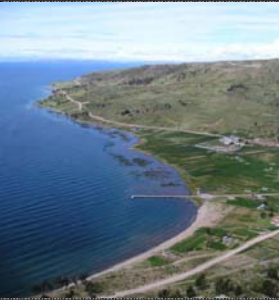
Playa de Juli .