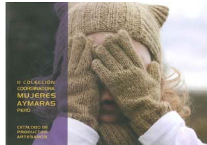
Catálogo colección 2010

En esta nueva colección 2011 destacan los complementos