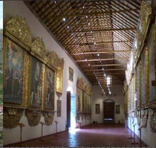
S Juan de Letrán