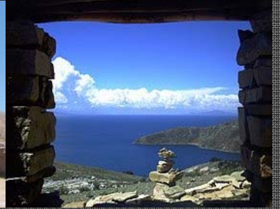
lago Titicaca desde Juli